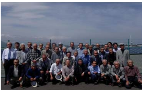
メガソーラーしみず 平成27年5月22日

さて、先に清水区のメガソーラーを見たが、二千三百世帯の需要を賄えると知り、面積を確保すれば相当大規模が可能と感心した。ただ、太陽光パネルの