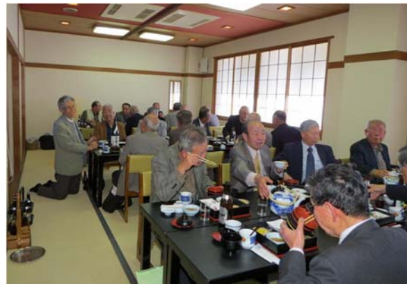
新年懇親会 (平成28年1月23日) ジャズミン(茉莉花)クラブにて