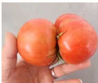
珍しいトマトがとれました

冬ではビタミン大根、紅芯大根、赤大根等沢山取れますので近所の方、会社の同僚にも食べて頂いています。非常に喜んで貰えて又、張り合いが出てきますし健康にも程良い運動です。孤野方面に来られましたら何時でもお寄り下さい。