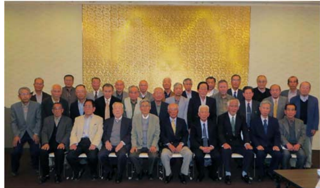
中部電力浜岡原子力館見学 (平成27年5月22日)